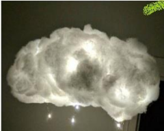
kies je vorm bijv. losjes