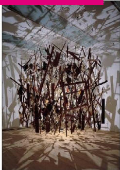
Cornelia Parker 'een ontplofte visie'