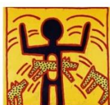
diepe blijdschap Keith Haring

Er zijn kunstenaars op het internet te vinden. Als je zoekt op (bijv.): Keith Haring, tekeningen. etc