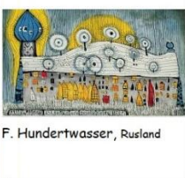
F. Hundertwasser, Rusland

Stuur je tekening als foto op dan plaatsen wij die in het on-line museum. www.cubahof.nl/online-museum