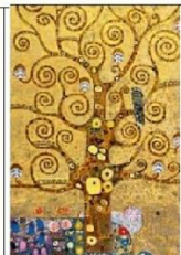
Gustav Klimt, levensboom.