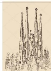
Antoni Gaudi, kathedraal